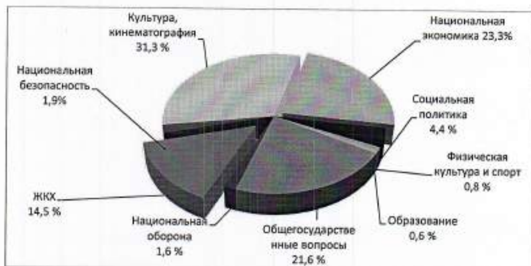
Рис. 2. Структура расходов бюджета Райгородского сельского поселения за 9 месяцев 2023 года

Структура расходов бюджета Райгородского сельского поселения за 9 месяцев 2023 года по разделам классификации бюджета представлена на рисунке 2.